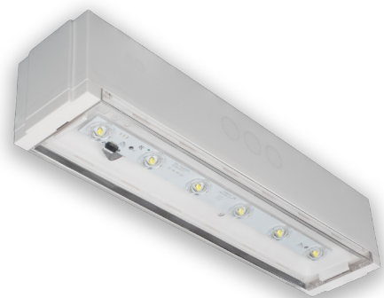
Leuchte der Baureihe KQ mit integriertem Lithium-Akkumulator